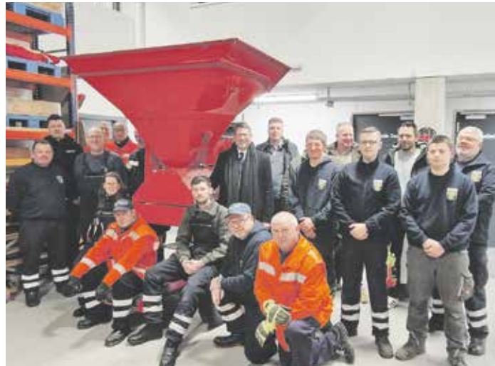
Die 3. Gruppe der Freiwilligen Feuerwehr Sickinge übte an der neuen Sandsackfüllmaschine der Samtgemeinde Sickinge. Mit dabei waren auch Vertreter von Rat und Verwaltung sowie der Firmen HGS und Steffen aus Sickinge

regelmäßig geübt werden, sodass sich die Abläufe und der Umgang mit der Maschine einspielen. Klar wurde aber auch: Die positiven Effekte, die sich alle vom Einsatz der Maschine versprochen haben, werden wohl eintreten.