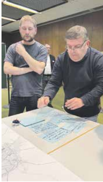
Die Teilnehmer am Workshop erarbeiteten viele Vorschläge zu dem geplanten Fahrradkonzept in Schöppenstedt