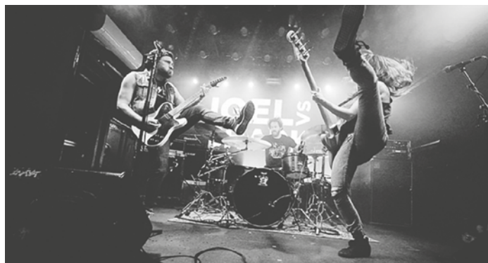
»Igel vs. Shark«

Karten gibt es bei Lotto-Ebbers auf dem Steinweg in Schöppenstedt und auf www.ackerfest.com im Vorverkauf für 14 Euro. An der Abendkasse werden die restlichen Tickets für 19 Euro zu haben sein, wobei die Gesamtkartenzahl begrenzt ist.