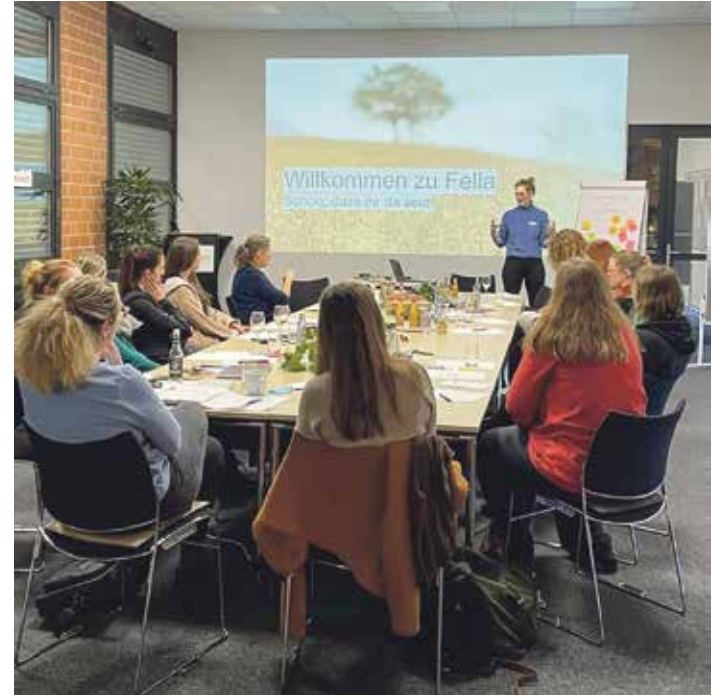
Auftaktveranstaltung des Fella-Netzwerkes

Ländliche Regionen stehen oft vor der Herausforderung, dass junge, gut ausgebildete Frauen in die Städte abwandern. Doch dort, wo Frauen berufliche Perspektiven sehen, bleibt die gesamte Familie. Das bedeutet mehr Fachkräfte, mehr Innovation und letztlich eine stabilere Wirtschaft. Starke Netzwerke