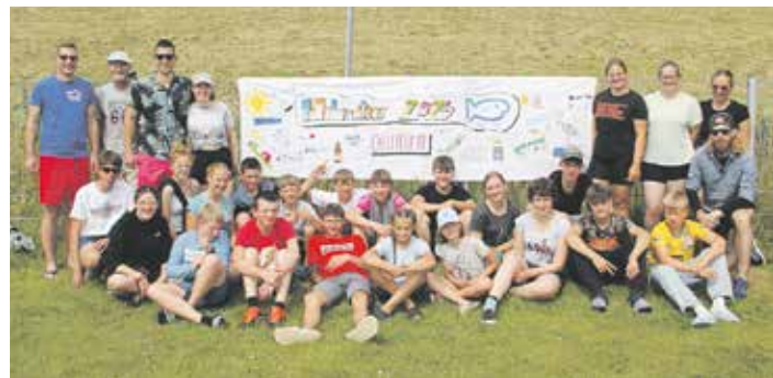
Gruppenfoto aus dem Jahr 2024

Mitfahren können Jugendliche zwischen zwölf und 17 Jahren. Der Teilnehmerbeitrag beträgt 250 Euro. Lust auf eine tolle Ferienwoche? Dann schnell anmelden auf www.fisch-radtour.de oder weitere Informationen anfordern unter info@fisch-radtour.de