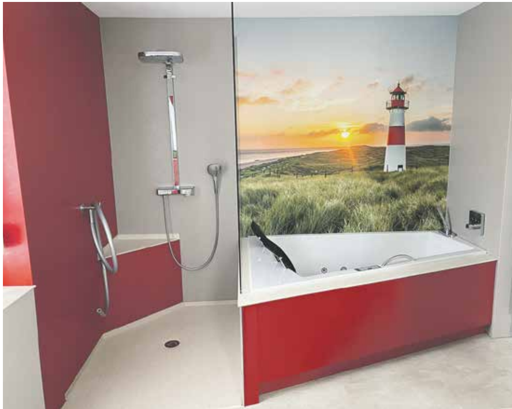
Roland Hörder freut sich auf Ihren Besuch der Hausmesse

Sie können nicht zur Hausmesse kommen, wünschen aber eine Beratung? Kein Problem! Kontaktieren Sie Roland Hörder unter 0151/19 001274 oder roland.hoerder@viterma.com.