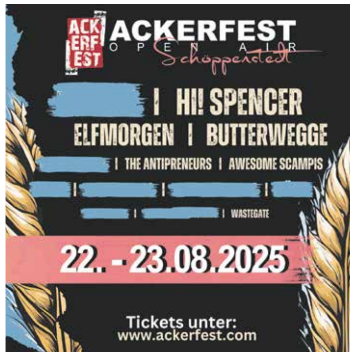
Das noch nicht vollständige Lineup des Ackerfest-Open-Airs 2025