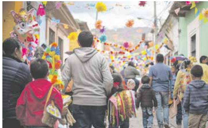
Bei den vorweihnachtlichen »Los Posadas« in Mexiko wird gesungen, getanzt und gefeiert, bis am Ende die Piñatas zerschlagen werden

Auf den Philippinen beginnt die Weihnachtszeit bereits im September und dauert bis Januar. Es gibt zahlreiche Feste, Paraden und beeindruckende Laternenwettbewerbe, bei denen kunstvoll gestaltete Laternen, »Parols« genannt, die Straßen erleuchten.