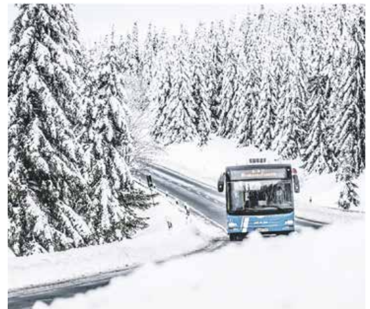
Ein KVG-Linienbus unterwegs im verschneiten Harz

Besonders die Nachhaltigkeit steht bei der KVG im Fokus: Bis 2025 wird deren E-Busflotte 25 Prozent ihrer gesamten Fahrzeuge ausmachen. Schon jetzt investiert die KVG in umweltfreundliche Technologien, um die Mobilität in unserer Region noch grüner und zukunftsfähiger zu gestalten. Mit jedem Fahrtantritt leisten die Fahrgäste einen aktiven Beitrag zum Schutz unserer Umwelt und der Lebensqualität in der Region. Die KVG Braunschweig bringt Menschen zusammen, auch zur Weihnachtszeit. Fahren Sie mit und erleben Sie, wie einfach, nachhaltig und verbindend der öffentliche Nahverkehr sein kann.