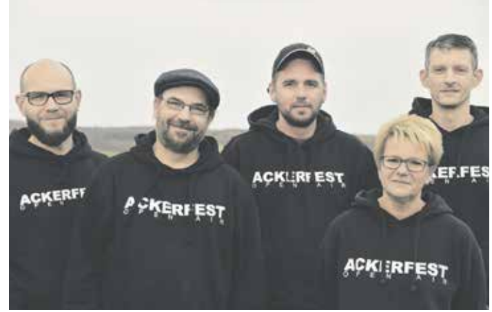
Der Vorstand des Vereins »Ackerfest«

wurden dazu ebenfalls genutzt. Die Organisation des Festes erfolgt in komplett ehrenamtlicher Arbeit eines etwa 20-köpfigen Planungsteams, das über die Festivalorganisation hinaus weitere Kulturangebote im Raum Schöppenstedt unterstützt und initiiert. Zum 24. Fest müssen die Veranstalter nun ihr Finanzierungs-konzept überdenken. »Steigende Kosten in sämtlichen Bereichen zwingen uns dazu, unser Umsonst-und-draußen-Konzept nach über 20 Jahren aufzugeben. Neben den vielen investierten Arbeitsstunden auch noch privat finanzielle Mittel einzubringen,