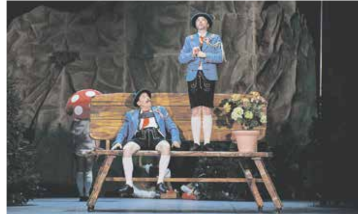
Szene aus der Operette »Im weißen Rössl«

Fantasie ist immer gut! »Momo« hilft allen Menschen ab sechs Jahren, ihre Fantasie wie-