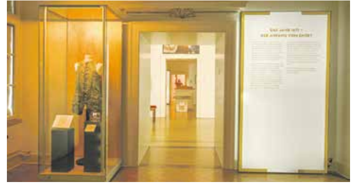
Blick in die Ausstellung

Mithilfe von Originalobjekten des 18. Jahrhunderts blickt das Museum am authentischen Ort auf das Leben am Wolfenbütteler