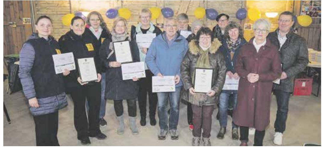
Vertreter aller Dörfer präsentierten stolz ihre Urkunden