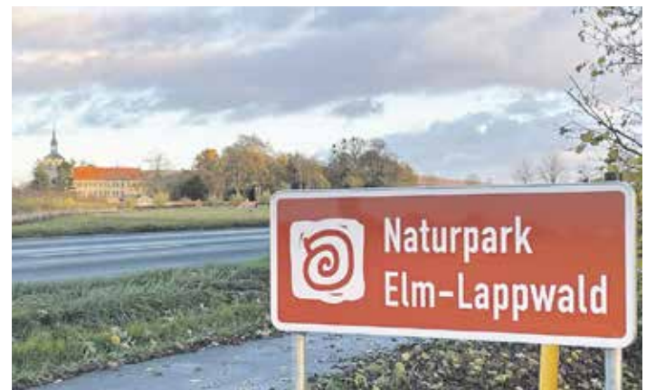
Touristisches Hinweisschild des Naturparks Elm-Lappwald an der L625 in der Nähe von Lucklum

Eine Beschilderung ist auch im Landkreis Helmstedt geplant. Dort sollen die Schilder Anfang