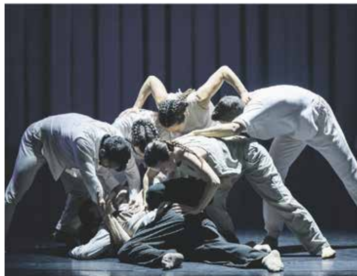
Szene aus »Don Quijote«

Karten gibt es in der Kassenhalle Großes Haus dienstags bis freitags von 10 bis 19.30 Uhr und sonnabends von 10 bis 14 Uhr, 0531/1234567, besucherservice@staatstheater-braunschweig.de .