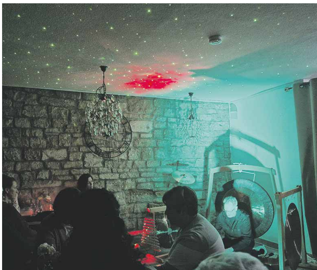
Im zweiten Teil des Abends gab es zu den Klängen eine zurückhaltende Lichtshow

Das gibt dem Klangkünstler sicher weiteren Rückenwind. »Ich plane auch in anderen Städten der Region, vor allem an außergewöhnlichen Orten, meine Klangmeditation und -performance zu präsentieren, um noch mehr Menschen klangvoll zu begegnen und zu erreichen«, ließ er wissen. Aktuelle Angebote finden sich auf www.klangentspannung-schwuelper.de .