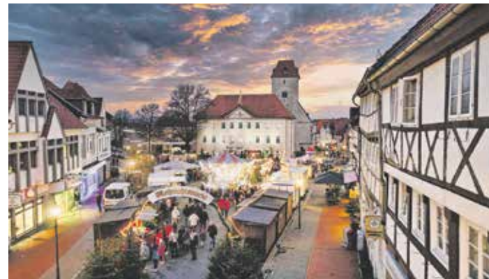
Der Schöninger Weihnachtsmarkt lockt auch dieses Jahr wieder mit einem bunten Programm

Für leuchtende Kinderaugen sorgen das Kinderkarussell und die Weihnachtsbäckerei. Die beliebte Aktion öffnet während des ganzen Weihnachtsmarktwochenendes wieder ihre Pforten. Alle Kinder sind herzlich zum Ausstechen, Verzieren, Backen und natürlich Naschen von Plätzchen eingeladen. Die Betreuung wird vom Jugendrotkreuz Schöningen übernommen. Der komplette Bio-Teig wird gesponsert von der Klosterbäckerei, Plätzchendeko