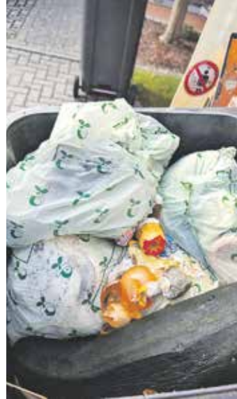
Bioplastikbeutel und Kunststoffe aller Art gehören nicht in die Bioabfalltonne.

Witton Bauelemente GmbH Dieselstraße 3 38350 Helmstedt Tel: 05351 55 61 0 Fax 55 61 51 info@witton.de www.witton.de