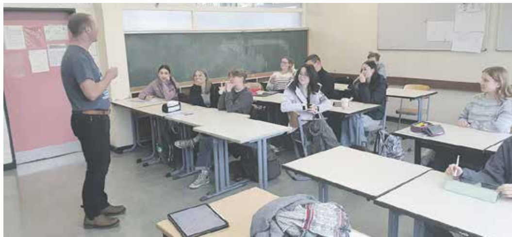
Cambridge-AG am Gymnasium Anna Sophianum

Im Rahmen dieses ergänzenden Sprachangebots analysieren die Schüler unter anderem anspruchsvolle Essays, die von der Lehrkraft als Mustertexte erstellt werden. Dabei erhalten sie die Aufgabe, gemäß den Cambridge-Richtlinien inhaltliche Verbesserungsvorschläge zu erarbeiten und dadurch ihre eigene Schreibkompetenz gezielt zu verfeinern. Darüber hinaus vertiefen sie ihre Lesekompetenz durch methodische Ansätze zur linguistischen Kohäsion – das heißt, die Fähigkeit, Texte durch sprachliche Verbindungen und inhaltliche Zusammenhänge strukturell und logisch kohärent zu gestalten. Diese Fertigkeiten wenden sie in