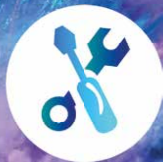
Montage & Haustechnik