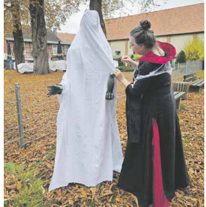
Ehrenamt im Till-Eulenspiegel-Museum heißt auch schon mal, als Vampirin Till zum Geist zu machen

Melden Sie sich bei Interesse gern. Sie erreichen das Till-Eulenspiegel-Museum unter 053 32/6158, info@eulenspiegel-museum.de oder persönlich während der Öffnungszeiten: dienstags bis freitags von 14 bis 17 Uhr sowie am Wochenende von 11 bis 17 Uhr.