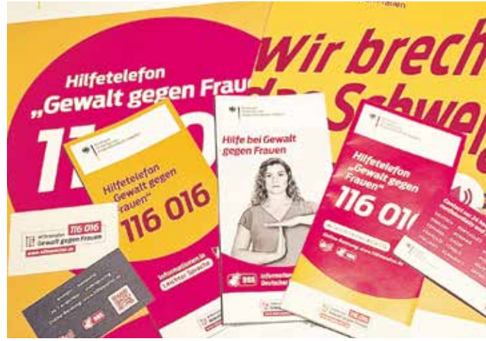
Eine Vielzahl unterschiedlicher Materialien des Hilfefonns »Gewalt gegen Frauen« für die Schaufensteraktion liegt schon bereit

Das Hilfefonns »Gewalt gegen Frauen« ist beim Bundesamt für Familie und zivilgesellschaftliche Aufgaben (BAFzA) angesiedelt.