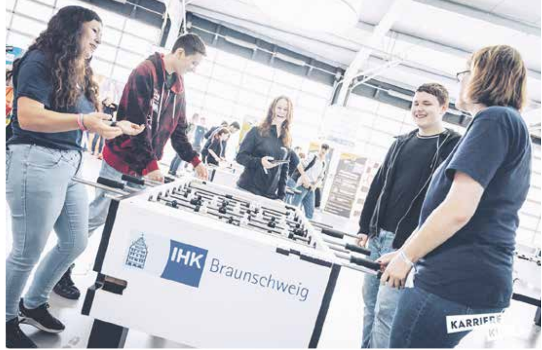
Impression vom »Karriere-Kick« Braunschweig im September 2023

»Schüler haben heute vielfältige Ansprüche und Bedürfnisse, wenn es um ihre berufliche Zu-