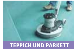
TEPPICH UND PARKETT

Aber bitte: Lassen Sie sich davon nicht aus der Ruhe bringen – wir übernehmen das gerne für Sie!