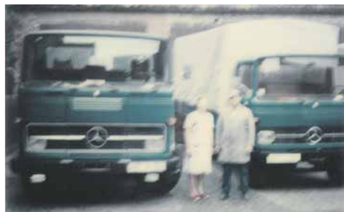
Ein Foto aus dem Jahr 1977: Wilfried Fricke's Eltern Ingeborg und Willi Fricke vor dem Mercedes 608 mit Plane und Spriegel und dem 1974 neu angeschafften Mercedes-Benz-1113-Containerfahrzeug

dienstes Fricke in Anspruch nehmen wollen, dann melden Sie sich einfach unter 05332/1460. Wilfried Fricke und sein Team helfen Ihnen gerne weiter. sn