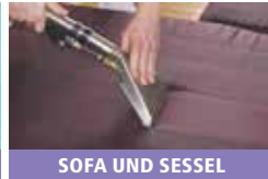
SOFA UND SESSEL