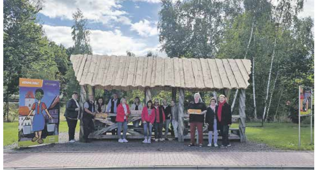
Brunnis Rastplatz ist nahezu fertig. Darüber freuen sich Stadt und Verkehrsverein

Schnell war der Name gefunden, dessen Patin die im vergangenen Jahr getaufte Wassermä-