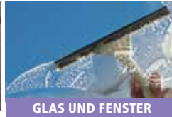
GLAS UND FENSTER