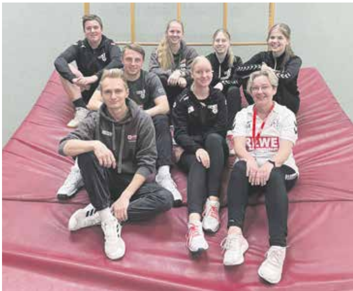
Das Team der HG Elm in der Turnhalle der Grundschule