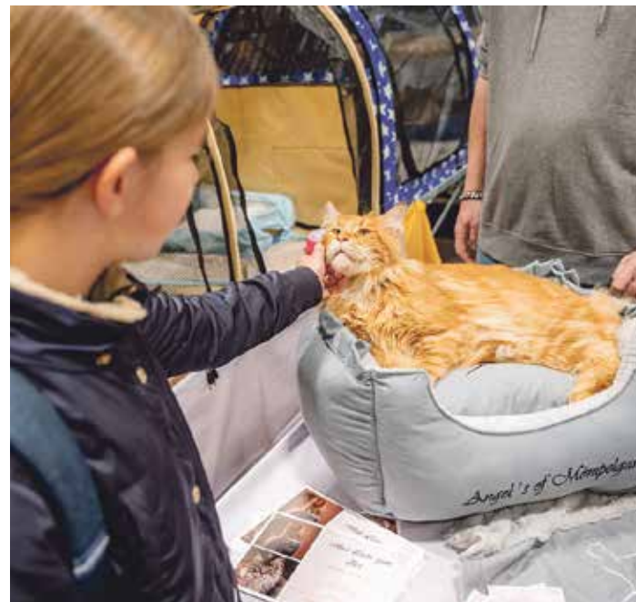
In der Messehalle 3 geht es um der Deutschen liebstes Haustier: die Katze

Karten sind im Vorverkauf auf www.messe-tierwelt.de erhältlich. Die Tageskarte für die »Tierwelt« kostet 9 Euro, ermäßigt 5,50 Euro, für mitgeführte Haustiere 1,50 Euro. Die Tages-Familienkarte (zwei Erwachsene und bis zu drei eigene Kinder/Enkelkinder) ist für 20,50 Euro zu haben. Für Kinder bis einschließlich sechs Jahre in Begleitung eines Erwachsenen ist der Eintritt frei.