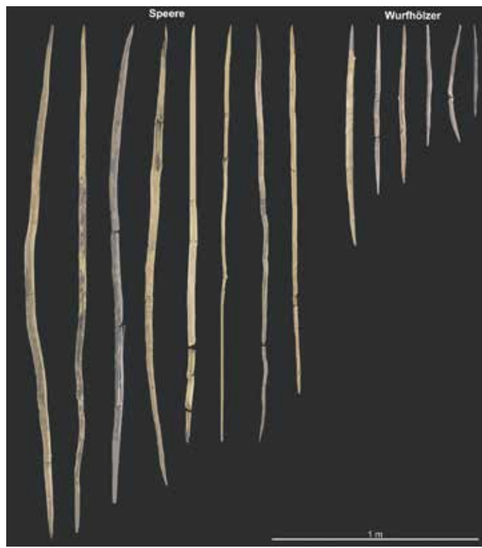
Speere und Wurfwürfel von der Fundstelle Schöningen wurden für die Jagd auf Groß- und Kleinwild verwendet (Fragmente wurden zeichnerisch ergänzt) Grafik: Dirk Leder, Niedersächsisches Landesamt für Denkmalpflege

Fundstelle auf Antrag des Landes Niedersachsen in die Nominierungsliste für das UNESCO-Weltkulturerbe aufgenommen.