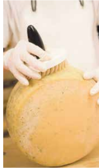
Die Käse aus der eigenen Milch werden täglich gepflegt

In Kooperation mit dem Gemüsebaubetrieb Lindenhof aus Eilum wurde eine solidarische Landwirtschaft ins Leben gerufen: Solawi-Landwandel. Durch