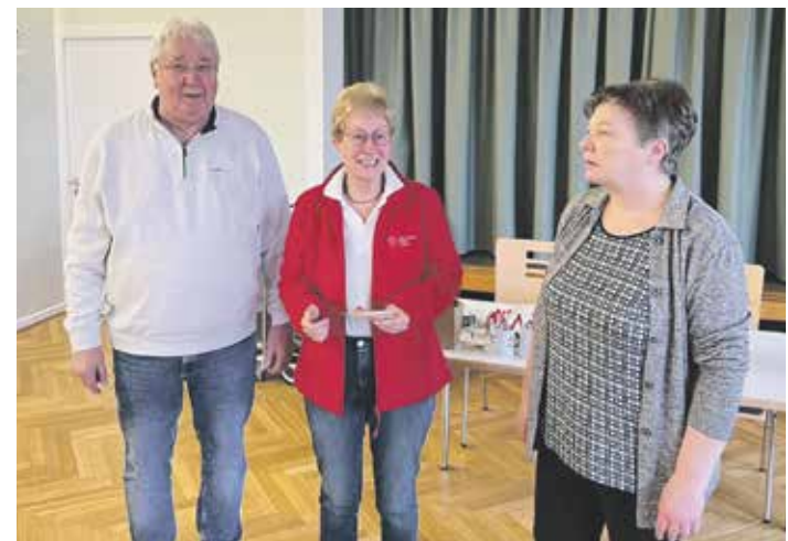
Der Sozialverband gab 150 Euro