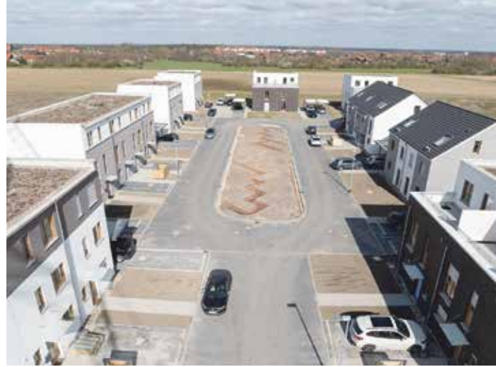
Freistehende Einfamilienhäuser, Reihenhäuser und Doppelhaus- hälften im Sonnenkamp

Antje Tiedt - Am Walde 1 - 38173 Veltheim - Tel. 05305/202782