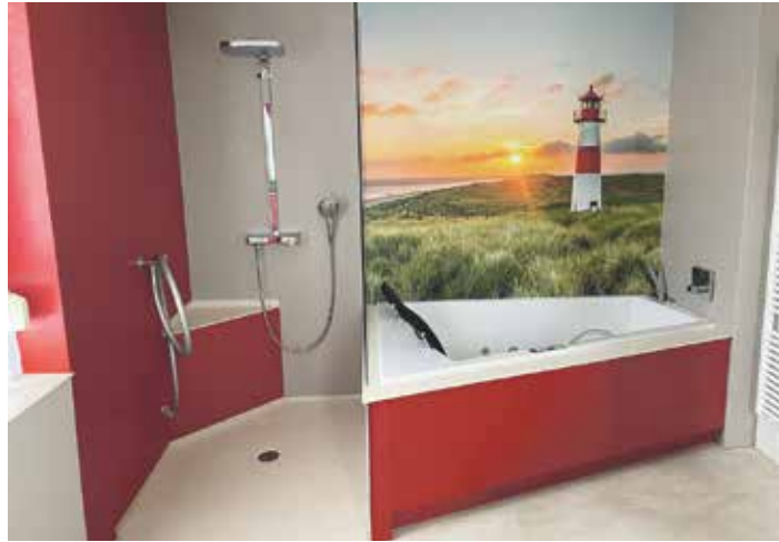
Roland Hörder freut sich auf Ihren Besuch

eine Beratung? Kein Problem! Kontaktieren Sie Roland Hörder unter 0151/19 0012 74 oder roland.hoerder@viterma.com.