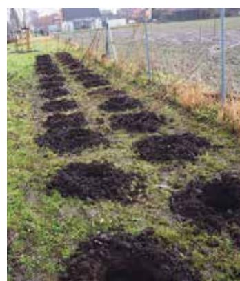
Pflanzlöcher für die Hecke

Ende Januar pflanzte eine Baumschule Nährholzhecken. Sie bestehen aus einer Mischung von