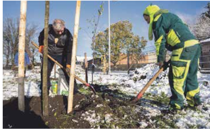
Pflanzarbeiten im Naturerlebnisgarten

Haselnuss, Weißdorn, Ölweide, Berberitze, Sanddorn, Filz-Rose und Kornelkirsche. Diese Hecken, in zwei Reihen angelegt, dienen als Windschutz und bieten Unterschlupfmöglichkeiten sowie Nahrung für Insekten und Vögel.