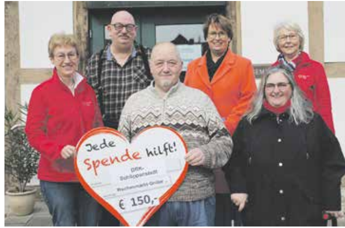
Die Wochenmarktgriller spendeten 150 Euro

Einsatzmöglichkeiten des Reanimationsgerätes. Der DRK-Ortsverein plant, das Gerät bei einer Veranstaltung in Schöppenstedt im Einsatz zu zeigen, um die Bevölkerung über seine Funktion aufzuklären.