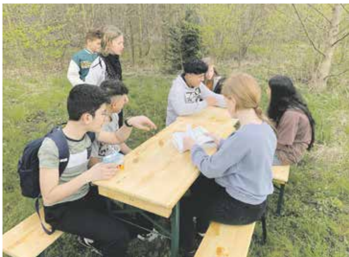
Die Durchführung von Projekten hat in der IGS Schöppenstedt einen hohen Stellenwert. Genutzt wird dabei unter anderem der eigene Schulwald

Wir ermöglichen allen Kindern einen sanften Übertritt von der Grundschule an die weiterführende Schule. Nicht nur unser System ohne Noten hilft dabei, sondern auch unser weitläufiges Schulgelände. So können wir ermöglichen, dass unsere Kleinen ein eigenes Gebäude mit einem eigenen Schulhof und einer eigenen Spielausleihe haben. Außerdem haben sie ein festes Lehrkräfteteam, das im gleichen Gebäude sitzt und arbeitet. Unsere Lehrerinnen und Lehrer arbeiten gemeinsam und zeigen so, wie Teamarbeit funktioniert, sodass die Schülerinnen und Schüler dies auch selbst im Unterricht umsetzen.