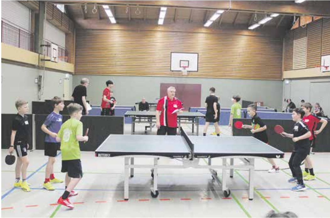
Szene aus dem Rundlaufturnier der roten Gruppe

Bei der blauen Gruppe gab es die Besonderheit, dass sich neben zehnjährigen Spielern auch zwei Jugendliche im Alter von 13 und