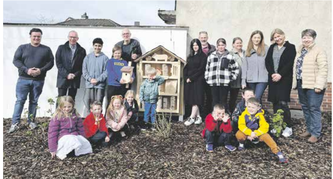
Die kleinen »Kräuterwichtel« und ihre Erzieher freuen sich sichtlich über das neue Insektenhotel