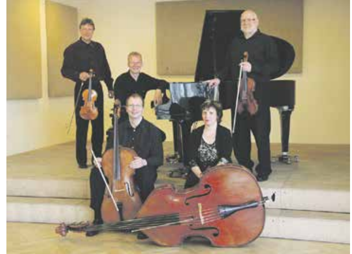
Mitglieder der Camerata Instrumentale Berlin spielen in Königslutter Klavierquintette