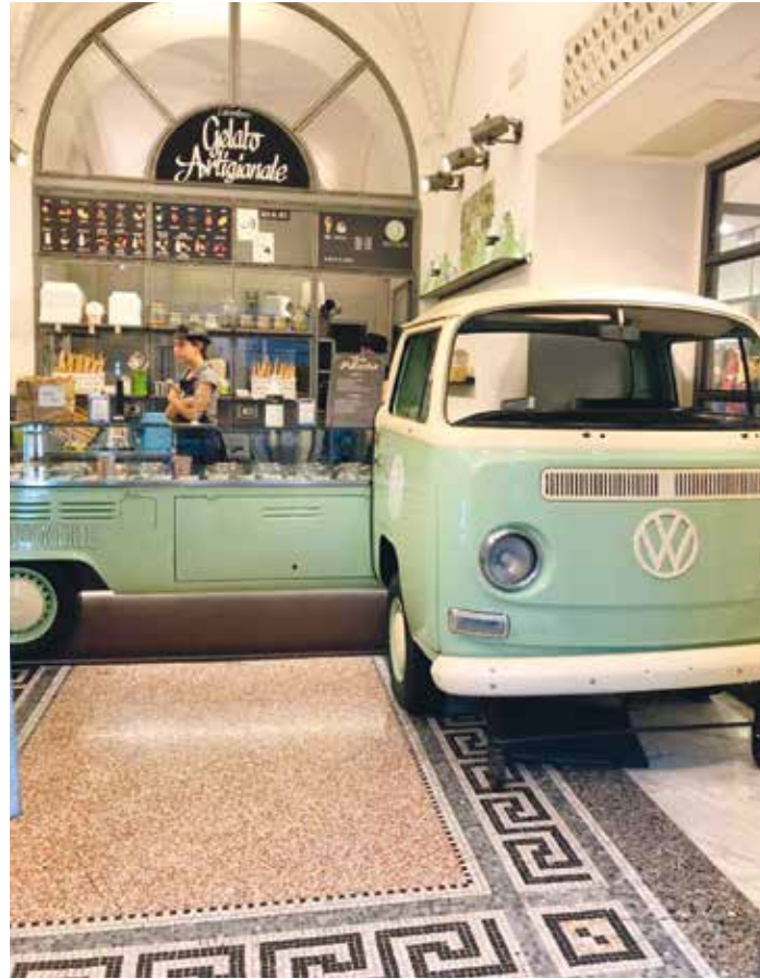
Mit dem System der Oberflächen-Optimierung von GST Steinglanz behandelter Fußboden

Die weiteren Vorteile: nahezu staubfreie Bearbeitung durch Nassschleifverfahren, geringe Beeinträchtigung der Bewohner, die Flächen sind während der Bearbeitung begehbare, keine Sperrung notwendig, hoher Beitrag zur Nachhaltigkeit, geringe Lebenszykluskosten, umweltentlastend durch Sanierung statt Erneuerung, sehr lange Haltbarkeit, reduzierte Reinigungskosten, positiver optischer Gesamteindruck und Werterhalt.